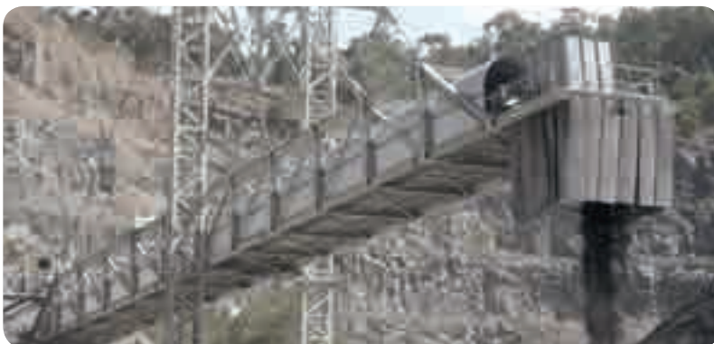
Anwendungsbeispiel ARENA-Haube – Australien

Die Arena-Haube ist durch den flachen Aufbau ideal für Förderbänder mit Überbauten, z. B. Schiffsbelader. Haubengröße nach Wunsch. Für alle Bandbreiten lieferbar.